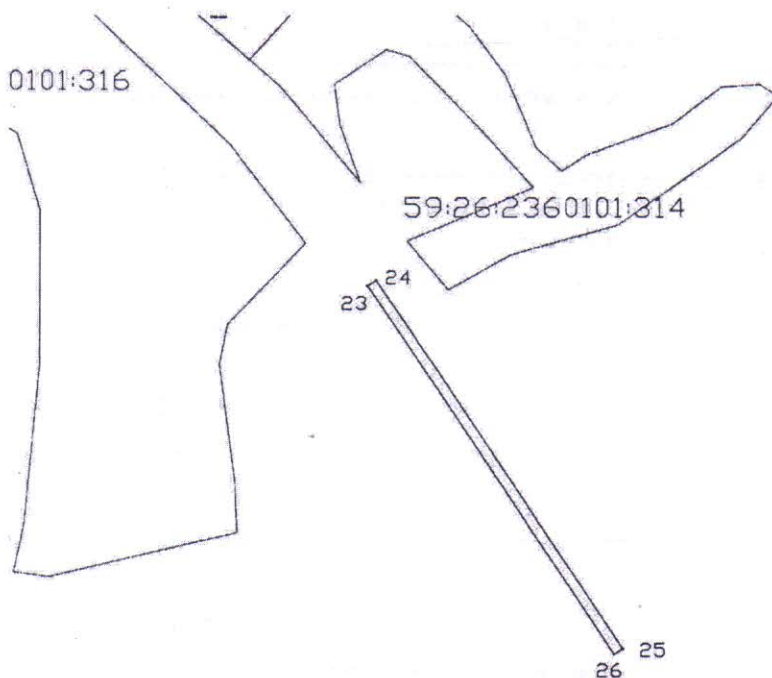
Координаты характерных точек

Цель использования: под объекты инженерного оборудования Электроснабжения (Строительство 2КТПП-100/10/0,4 кВ с двумя трансформаторами мощностью 25 кВА с телемеханизацией и учетом электроэнергии, строительство ВЛ 10 кВ с ПРВТ, ВЛ 0,4 кВ. Реконструкция ВЛ 0,4 кВ № 2 от ТП-50201 для электроснабжения РТС по адресу: Пермский край, Нытвенский р-н, Григорьевское с/п, в 0,079 км от д. Печенки (4500050938))