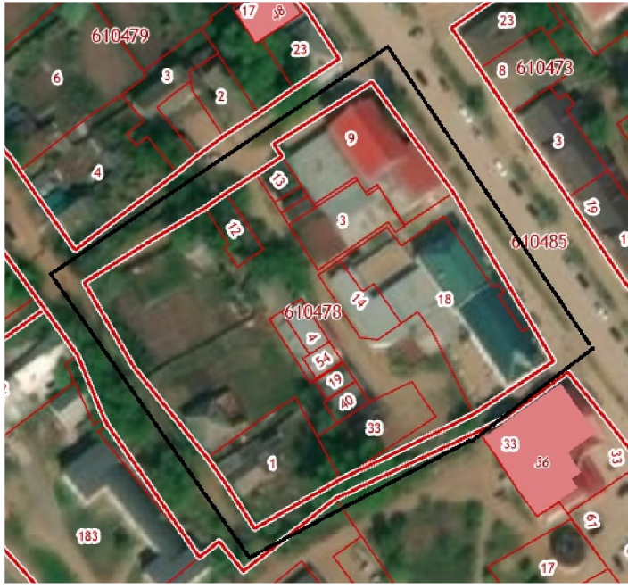
СИТУАЦИОННЫЙ ПЛАН Схема расположения элемента планировочной структуры (схема размещения проектируемой территории в структуре поселения)